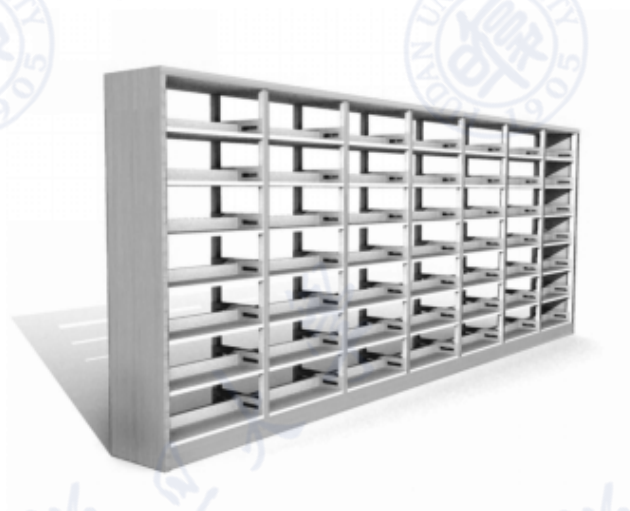
图示 3：钢木双面书架（含木质件）参考图