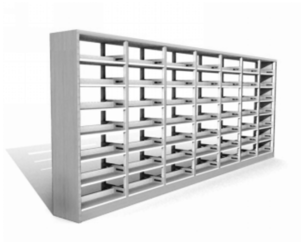
图示 3：钢木双面书架（含木质件）参考图